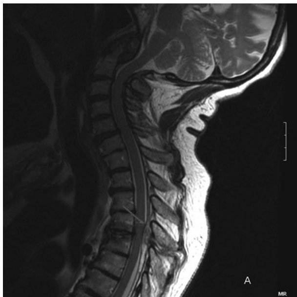
Figura 1. RM en la que se observa un hematoma epidural posterior D3-D6 con una extensión longitudinal aproximada de 7 cm. Obliteración del espacio subaracnideo posterior totalmente a nivel de D3 y D4 con moderado efecto masa sobre el cordón medular.

Presentamos un caso de HEE tardío atendido en el servicio de urgencias, tras un traumatismo craneoencefálico asociado a una fractura vertebral diez días antes, con compromiso del espacio subaracnideo posterior (Figura 1). Se le realizó cirugía descompresiva de urgencia con un resultado satisfactorio en el que se apreciaban cambios postquirúrgicos sin compresión medular (Figura 2).