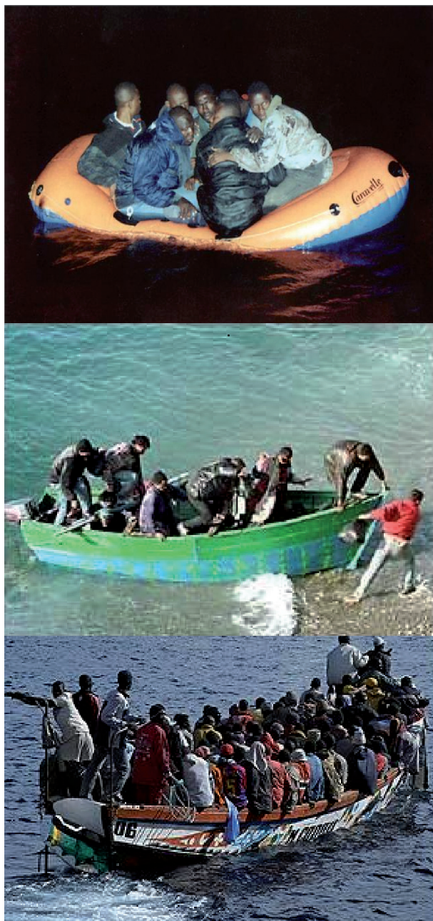
Figura 1. Diferentes tipos de embarcaciones empleadas por los inmigrantes: balsa (arriba), patera (centro) y cayuco (abajo).

larios (SUH) podrían ser especialmente vulnerables a cualquier incremento de la presión asistencial 2,3 . Además, el hecho que todo inmigrante en situación de urgencia tiene derecho a ser atendido con independencia de su situación administrativa hace que estos SUH y los Servicios de Urgencias de Atención Primaria (SUAP) soporten una parte sustancial de la carga asistencial de esta población 4 .