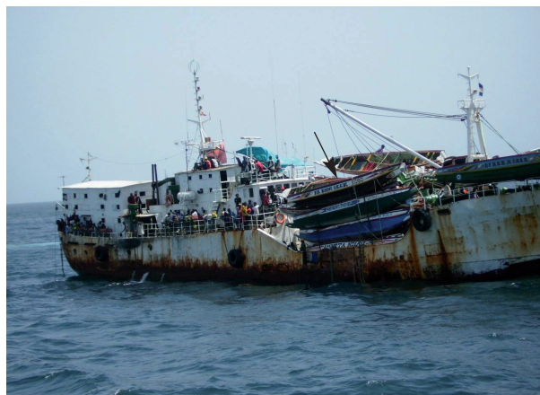
Figura 4. Fotografía de un supuesto barco nodriza izando diversos cayucos (flecha). Otros autores hablan de un método tradicional de pesca. (Publicada en el diario El Mundo el 30 de noviembre de 2006, 2ª edición, en la Sección España, página 22).

Un número importante de inmigrantes, que