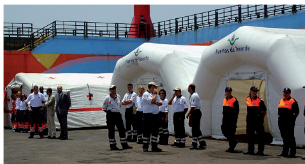
Figura 2. La gran frecuencia de llegadas de cayucos ha motivado que los puntos médicos avanzados estén instalados de forma permanente en el puerto de Los Cristianos.

proporciona junto con una ficha explicativa de posología y duración.