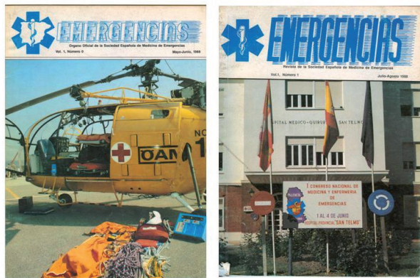
Figura 1. Portadas de los números 0 (izquierda) y 1 (derecha) de EMERGENCIAS.

da: sencillez y claridad. Así, la tipografía se ha cambiado, en todas las secciones de la revista, por una más actual y de un tamaño más grande que la previa. El espacio que así se haya podido perder se ha recuperado en buena medida ampliando la superficie de página utilizada y dejando menos márgenes en blanco. Para los trabajos publicados en las ya clásicas secciones de Originales, Editoriales, Revisiones, Documentos de Consenso, Artículos Especiales, Puntos de Vista, Notas Clínicas e Imágenes los nombres de los autores se presentan, ahora en todas ellas, en la cabecera del artículo y de forma completa (permite distinguir entre hombres y mujeres), y los apellidos se significan de forma clara escribiéndolos en mayúsculas (facilita su identificación por parte de lectores no acostumbrados a la onomástica latina). El sumario (requerido en todas estas secciones excepto Editoriales, Puntos de Vista e Imágenes), que en muchas ocasiones es lo único que se lee un lector no interesado específicamente en el tema en cuestión, adquiere un mayor protagonismo, con un tamaño suficiente para una lectu-