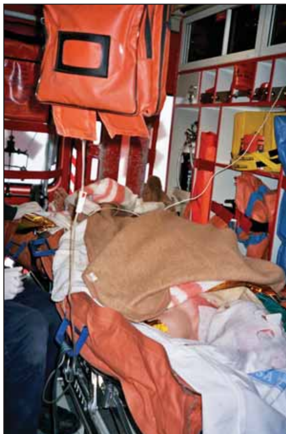
Figura 4. Prevención de la hipotermia mediante la perfusión de líquidos calientes y medios físicos.

La tasa de infusión recomendada varía según autores. Nosotros hemos empleado la fórmula de Parkland, que aconseja utilizar un ritmo de 4 ml/kg/ %SCQ en las primeras 24 horas, infundiendo la mitad del volumen calculado en las primeras