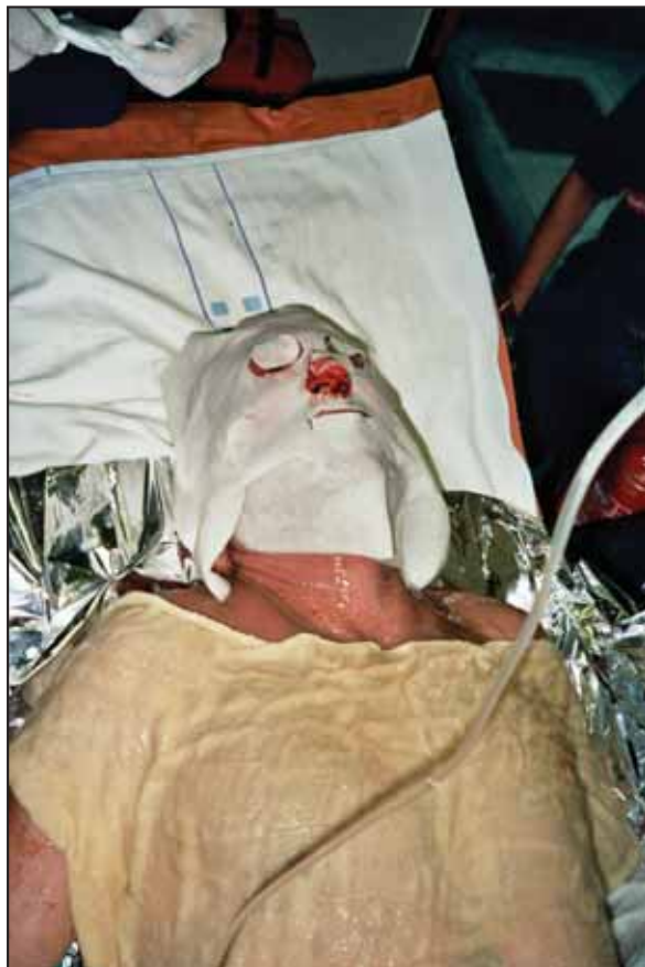
Figura 3. Aplicación del apósito facial y corporal de hidrogel.

Lo dicho anteriormente y las ventajas de su colocación 27 (Tabla 3) hacen que en nuestro servicio las empleemos habitualmente, teniendo en cuenta una serie de acciones que eviten el peligro de hipotermia. Éstas son: cubrir las zonas de aplicación de hidrogel con mantas isotérmicas aluminizadas, sábanas limpias y cubrir todo con mantas 28 , además si se considera oportuno, se realiza calefacción en la cabina asistencial de la ambulancia 28,29 y calentamiento de la perfusión de Ringer® lactato mediante el dispositivo especial Hot Sack® 30,31 (Figura 4).