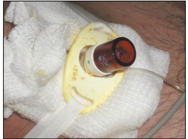
Figura 2. Cánula de traqueostomía del nº 8 con cánula interna y sistema de fijación.

En el caso que presentamos, se realizó un acceso de emergencia a la vía aérea mediante una técnica de traqueostomía percutánea con dilatación en un único paso que permitió,